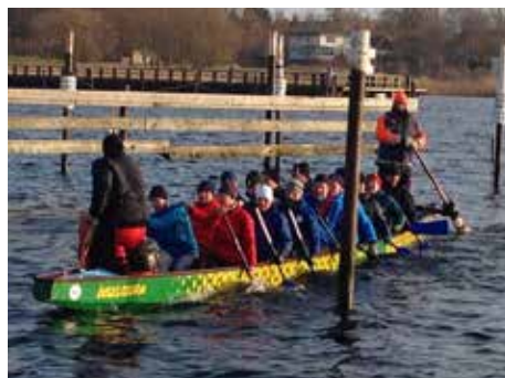
Das Neujahrstraining am 01. Januar 2020 des Poeler SV Drachenbootes begeisterte alle Aktiven.