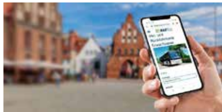
Fahrscheinkauf im NAHBUS Online-Shop

Der Kauf von Tageskarten – genau wie alle anderen Fahrscheinarten – geht im Online-Shop schnell und unkompliziert, da eine Registrierung hierfür nicht notwendig ist. Lediglich die Angabe einer E-Mail Adresse ist erforderlich, an die der Fahrschein umgehend nach Kauf per E-Mail gesendet wird. Der Fahrschein kann dann als