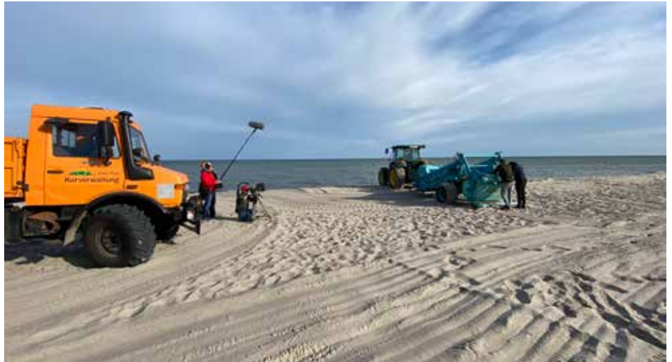
Dreharbeiten zur Seegrassbergung und -verwertung in Timendorf-Strand für die Sendung Mare TV

Seit Mitte Juni stehen dem Hauptrevier Wismar zwei zusätzliche Beamte aus dem Bereitschaftsdienst für den Bäderdienst zur Verfügung. Sie werden für die Bereiche Neukloster-Warin,