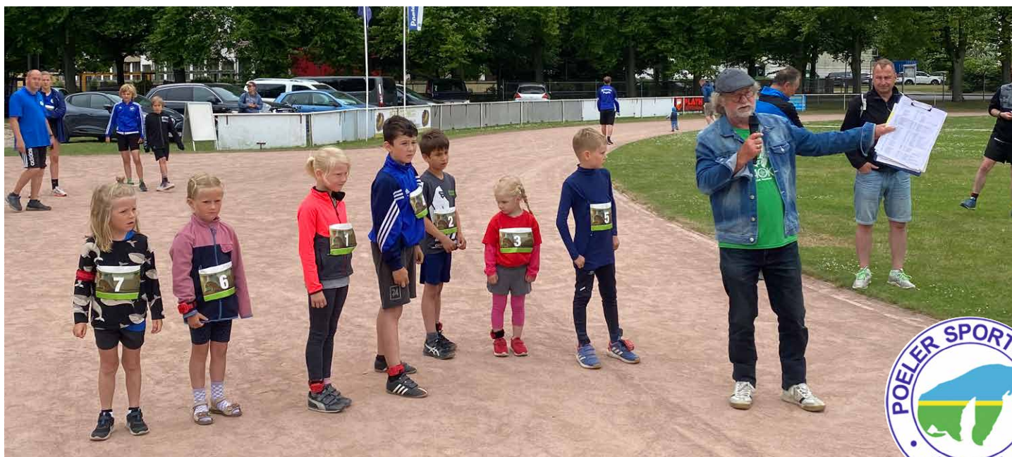
Start der jüngsten Teilnehmer, die sich auf der 1-Kilometer-Strecke ausprobiert haben.

die 5-Kilometer-Strecke und stellten fest, dass es ein verdammt gutes Gefühl ist, wenn man die Komfortzone mal verlässt und etwas Neues ausprobiert.