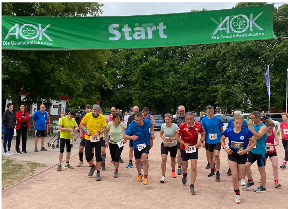
Start der Läufer zur 11-Kilometer-Distanz