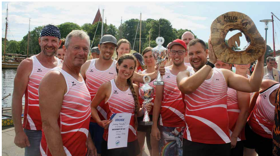
Beim 1. Poeler Drachenboot-Cup waren die „Sternberger Pastinetten“ die Gesamtwertungs-Sieger.