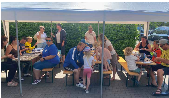
Muntere Tausch- und Sammelbörse am Parkplatz von REWE am 17. Juni 2023

Zeitgleich mit dem Festakt wurde ebenfalls die offizielle Festschrift, welche unter dem QR-Code auf der nächsten Seite als Download zur Verfügung steht, veröffentlicht. weiter S. 2