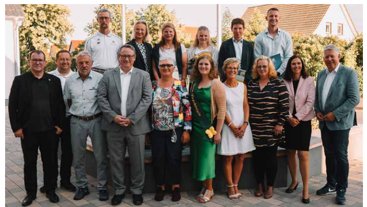
Die geehrten Vereinsmitglieder zusammen mit Vertretern aus Politik, Gemeinde und Verbänden