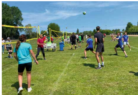
Munteres Spiel bei unserem Volleyballturnier