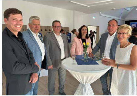
Empfang im Haus des Gastes