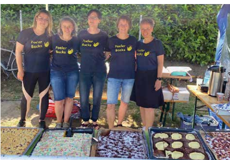
Die Volleyball-Frauenstaffel beim Kuchenverkauf auf dem Sportplatz

Auch danach geht es mit Fußball weiter. Die Traditionsmannschaft des 1. FC Union Berlin kommt mit seinen Altstars auf die Insel, um sich mit unseren „Profis“ auf dem Sportplatz zu messen. Karten für dieses Spiel sind bei der