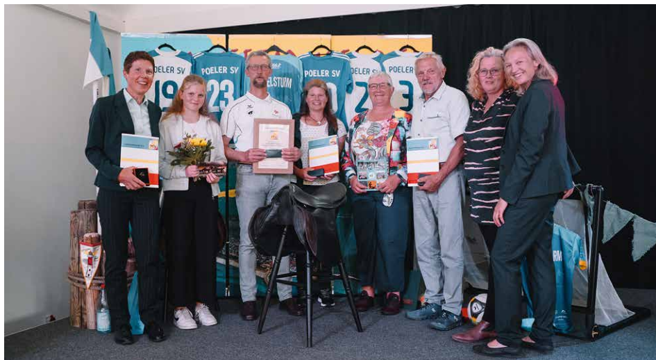
Die geehrten Mitglieder aus der Staffel „Reiten und Fahren“ zusammen mit den Verbandsvertretern