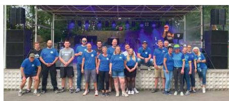
Ein Teil der Helfer vom Schlosswall – ohne Euch alle keine Party – DANKE!!