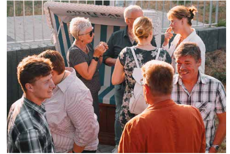
Austausch der Gäste beim Festakt