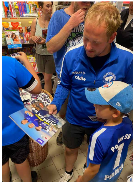
Familie Pfeiffer beim Kauf des Stickeralbums

Weiter ging es am 23. Juni mit unserem offiziellen Festakt im Haus des Gastes in Kirchdorf für verdiente Mitglieder, Trainer, Sponsoren und Politik.