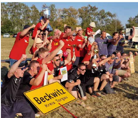
Gruppenbild nach der Siegerehrung der Männer, Plätze 1 bis 3