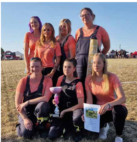
Stover Frauen nach der Siegerehrung für ihren 2. Platz