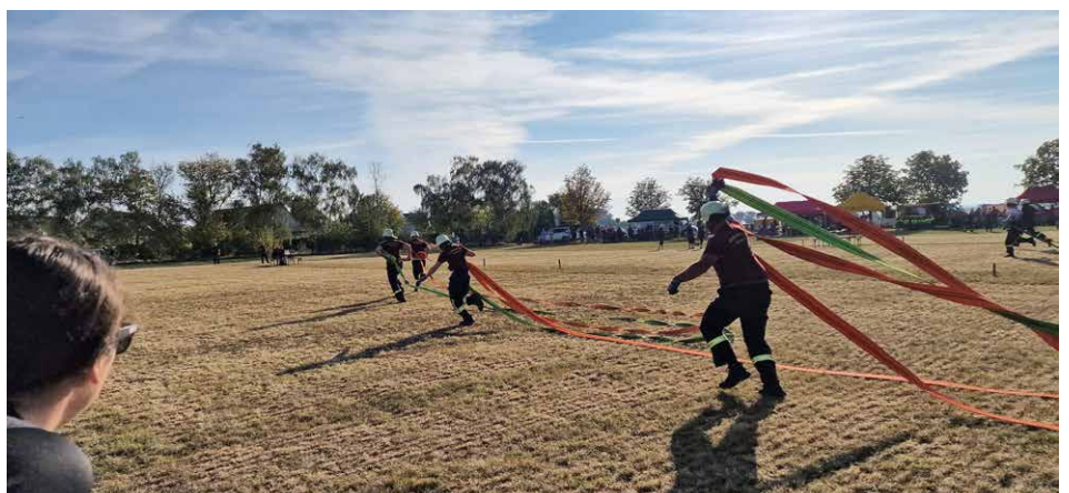
Durchführung des Löschangriffs