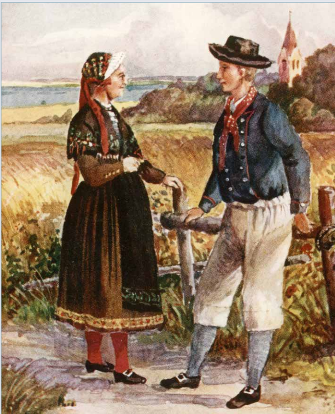
So etwa mag Ackermann bei diesem Paar den „weiblichen Anzug“ gesehen haben.

„Kaum miteinander bekannt geworden, schwatzten wir treuherzig über ihre Verhältnisse und Eigentümlichkeiten, wobei auch die Naivität der Mutter Wirtin, mit welcher sie mir in dortiger Mundart die häufigen Schlägereien und Raufereien der Insulaner schilderte, nicht wenig ergötzte. Besonders der im Monat September gehaltene Jahrmart in