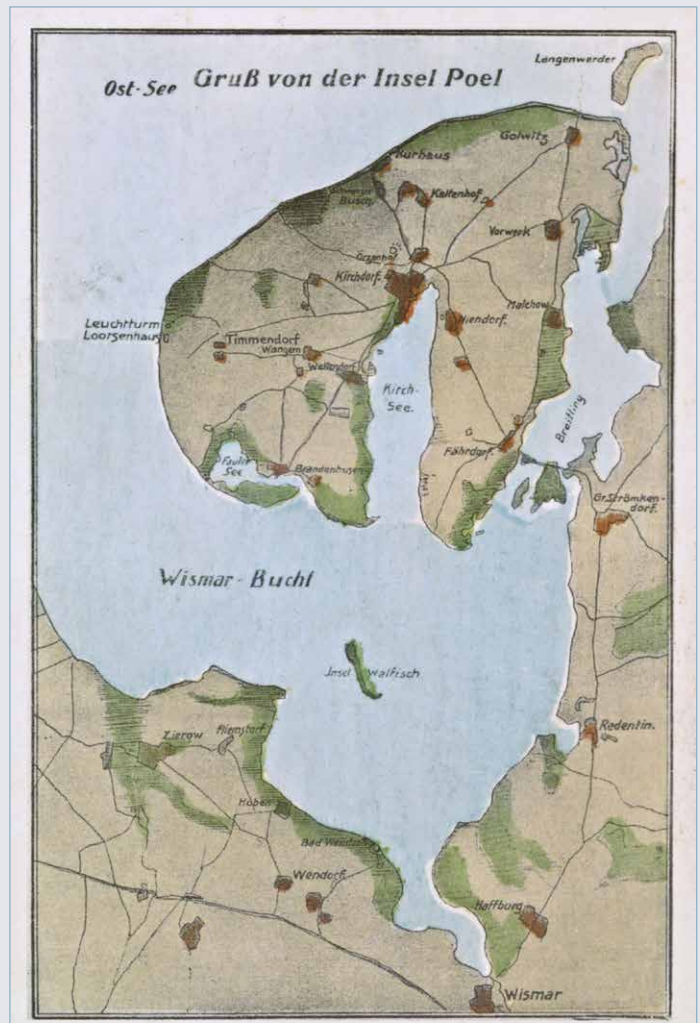
Ackermanns Reiseziel präsentiert sich hier auf dieser schönen Postkarte. Allerdings wird er nicht den hier bereits verzeichneten Timmendorfer Leuchtturm zu Gesicht bekommen haben, denn der entstand erst im Jahre 1871.

Kirchdorf endete in den meisten Fällen mit den gefährlichsten Balgereien.“ Ackermann nennt für das Jahr 1826 eine Einwohnerzahl auf Poel von 1.530 Personen, von denen die angesehensten untereinander verwandt und verschwägert seien. Ein Lob wird nicht den Frauen, sondern den Männern ausgesprochen, sie seien „unstreitig schöner als das weibliche Geschlecht“. Zum Schluss gibt Ackermann noch eine Charakteristik der Poeler. Er beschreibt sie als „groß und kräftig und er befürchte nicht, dass der fleißige Branntweingenuss sie entnerven und erschlafe. Es herrsche bei den Poelern eine bessere Aufklärung und Bildung als bei anderen Landbewohnern“. Und Ackermann schrieb weiter: