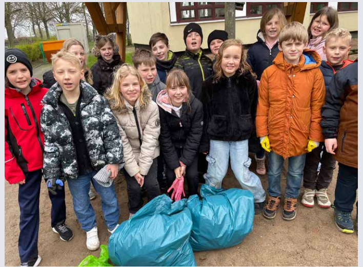
Die 3. Klasse der Regionalen Grundschule hat bereits am 21. März 2024 fleißig Müll gesammelt. Am Ende der Aktion zeigten sich die Schulkinder sehr entsetzt, wo überall in der Natur Müll zu finden war.