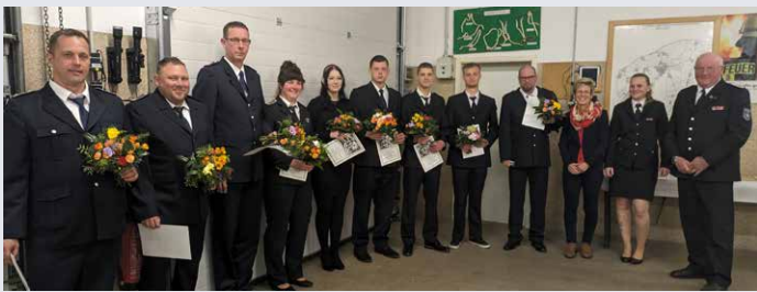
Beförderungen wurden ausgesprochen zum Oberfeuerwehrmann bzw. zur Oberfeuerwehrfrau, zum Hauptfeuerwehrmann bzw. zur Hauptfeuerwehrfrau und zum Löschmeister.