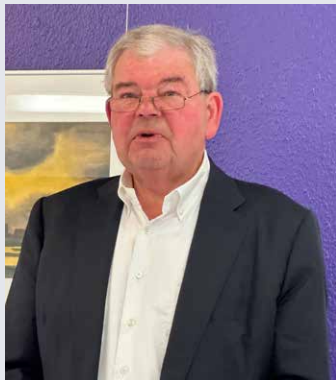
Der Vereinsvorsitzende der Karl Christian Klasen Gesellschaft e. V. führte in die Ausstellung ein.