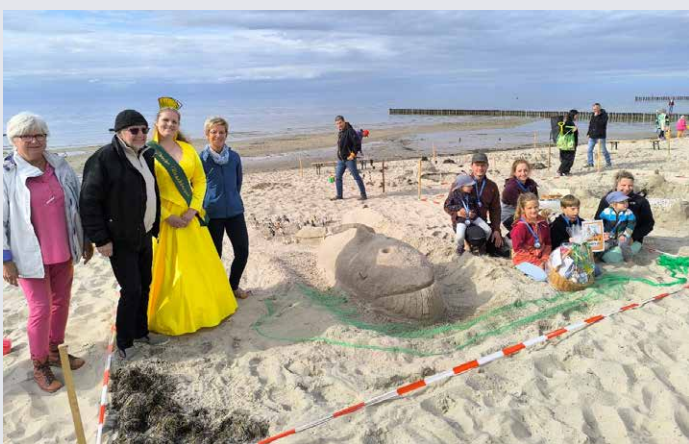
2025 erkämpfte sich das Team „Die Sandwürmer“ den 1. Platz.