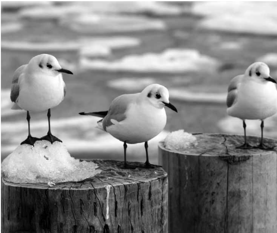
Der Winter hielt nun doch noch am 29. Januar Einzug und brachte die ersten fünf Zentimeter Schnee. Am ersten Februarwochenende fiel dann die Temperatur auf -19^{\circ}\text{C} , die letztmalig im Jahr 1956 in dieser Art gemessen wurde.