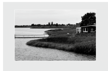
Foto des gleichen Motivs, 2012