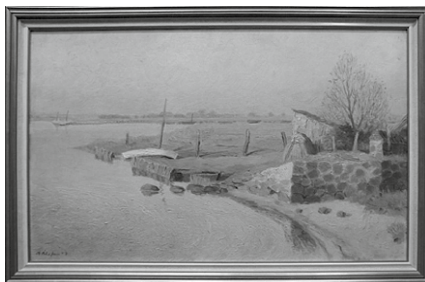
Originalbild von Klasen: „Steinmauer am Brückenhaus“, Öl, 1943

Zur Veranschaulichung ist hier ein Beispiel aufgezeigt: