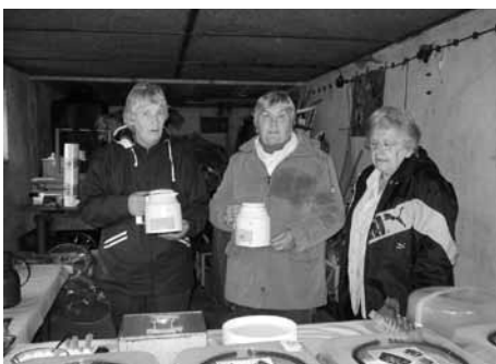
Das Kuchenteam des Vereins versorgte alle Gäste mit Selbstgebackenem.