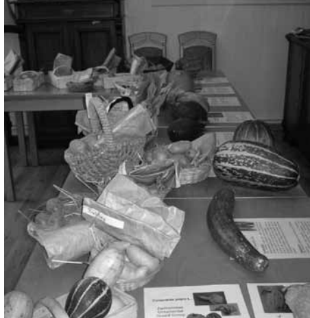
Bei der Zusammenstellung der Kürbis-, Kräuter- und Kartoffelausstellung unterstützten uns die Genbank und der Schaugarten Malchow.