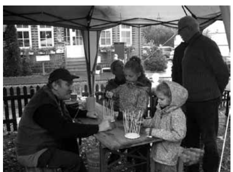
Körbflechten nicht nur für Kinder

Zusätzliche Veranstaltungen werden extra bekanntgegeben. Der Vorstand