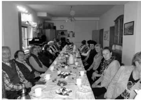
Die gemütliche Kaffeerunde zur Seniorenweihnachtsfeier

erstaunlich, wie textsicher und mit wie viel Talent sie agierten. Über den großen Beifall freuten sie sich sichtlich.