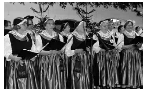
Weihnachtsauftritt des Chores „Poeler Leben“ im Erdbeerhof Glantz

Zusätzliche Veranstaltungen werden extra bekanntgegeben. Der Vorstand