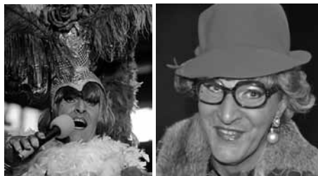
Die „Wilde Hilde“ schlüpft in mehrere Kostüme.

wissen endlich, wer die Ehre der Insel vertreten darf bei der Bauernolympiade zum Kreisernedankfest am 20. September. Zum Abschluss der Tagesveranstaltung entführt „Der Hexer“ das Publikum in die geheimnisvolle Dimension der Magie. Rund 45 Minuten taucht das Publikum in die Welt der Illusionen ein, bei dem der Menschenverstand buchstäblich auf den Kopf gestellt wird.