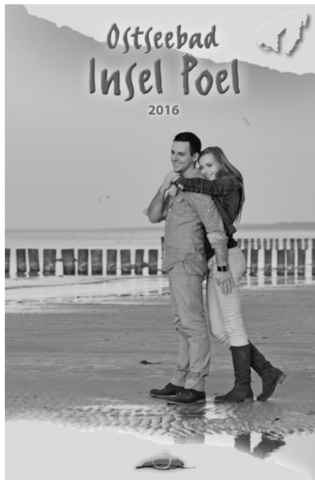
Nr. 1 noch attraktiver zu gestalten. Das neue Titelbild zeigt unsere ehemalige Rapskönigin

Auf 62 Seiten kann der Interessent sich nicht nur einen Überblick über passende Unterkünfte verschaffen, sondern auch allerhand Informatives über die Insel erfahren, über Sehenswürdigkeiten, Ausflugstipps und natürlich auch Ansprechpartner, wenn es z. B. darum geht, wo man ein E-Bike leihen kann oder wer Massagen anbietet. Auch das Kartenmaterial wurde erneut aktualisiert und ermöglicht dem Gast eine noch bessere Orientierung, um Ausflüge effektiver planen zu können. Des Weiteren wurden zahlreiche Fotos ausgetauscht, Schriftarten und -farben angepasst und der Inhalt aktualisiert, um das Werbemittel