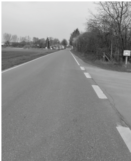
L 121 – Ortslage Wangern