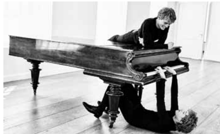
Lucas und Arthur Jussen

Mozart: Klavierkonzert Nr. 12 A-Dur KV 414 Mozart: Klavierkonzert Nr. 14 Es-Dur KV 449 Brahms: Ungarische Tänze – Walzer für Klavier zu vier Händen (Auszüge) u. a. Preise: 40/30 Euro (zzgl. VVK-/AK-Gebühr)