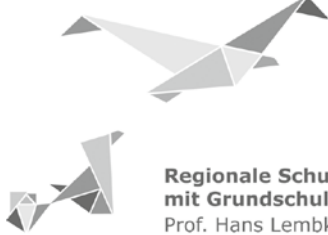
Regionale Schule mit Grundschule Insel Poel Prof. Hans Lembke

Auf Initiative des Schulfördervereins und vieler Sponsoren konnte dieses Projekt umgesetzt werden. Vielen Dank für die Idee und die sehr gute Zusammenarbeit.