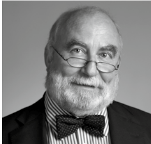
DER INSELMAKLER am Schwarzen Busch