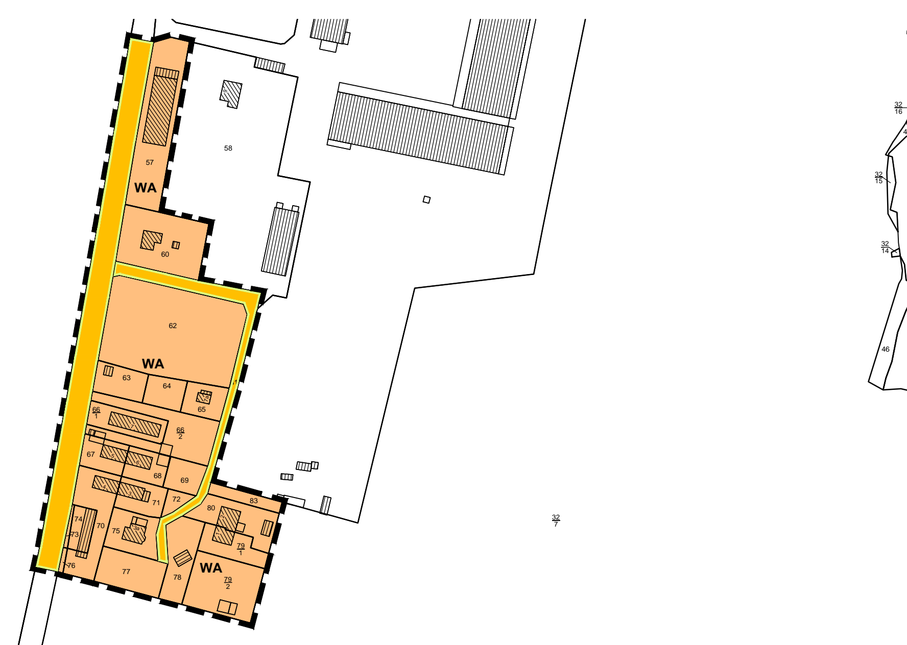
Geltungsbereich 3 des Bebauungsplanes Nr. 43 „Ortslage Malchow“: