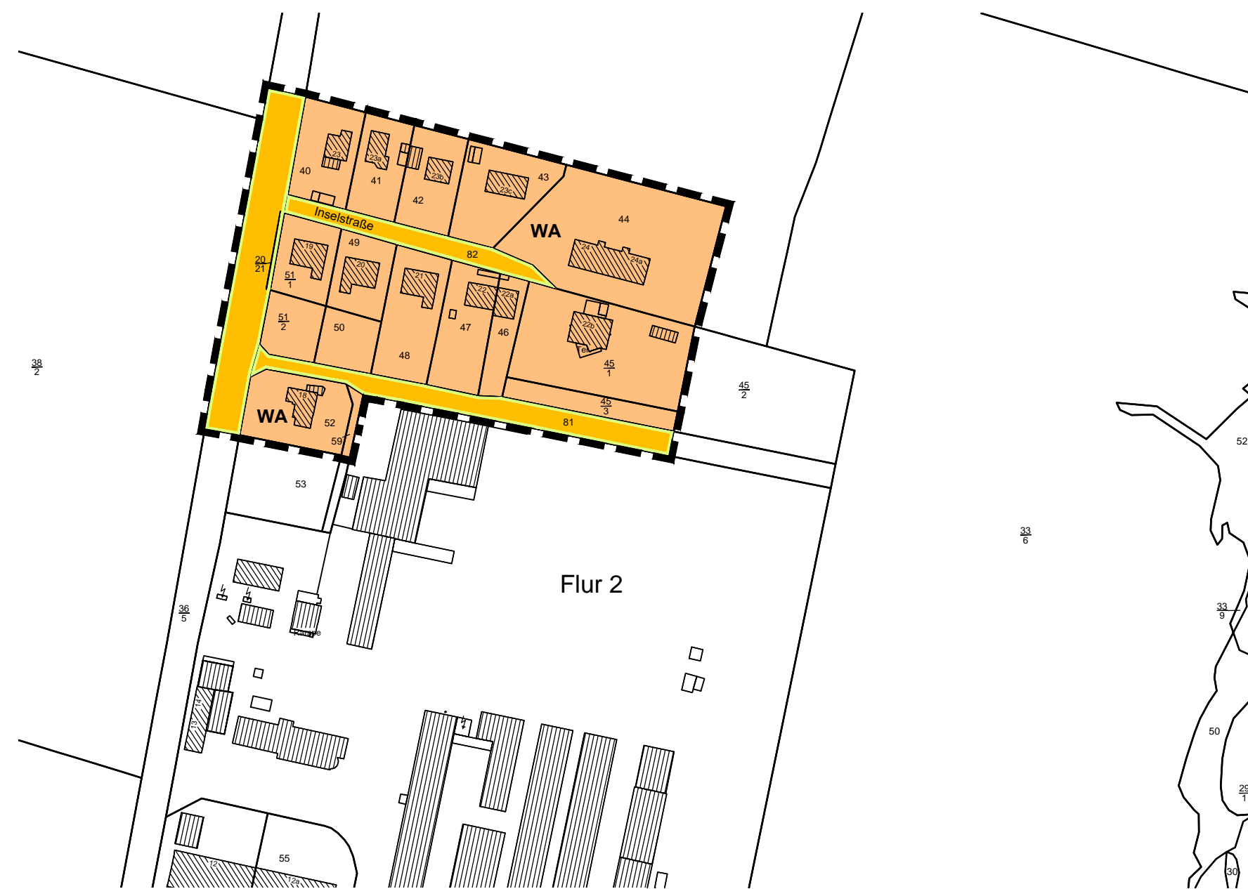
Geltungsbereich 2 des Bebauungsplanes Nr. 43 „Ortslage Malchow“: