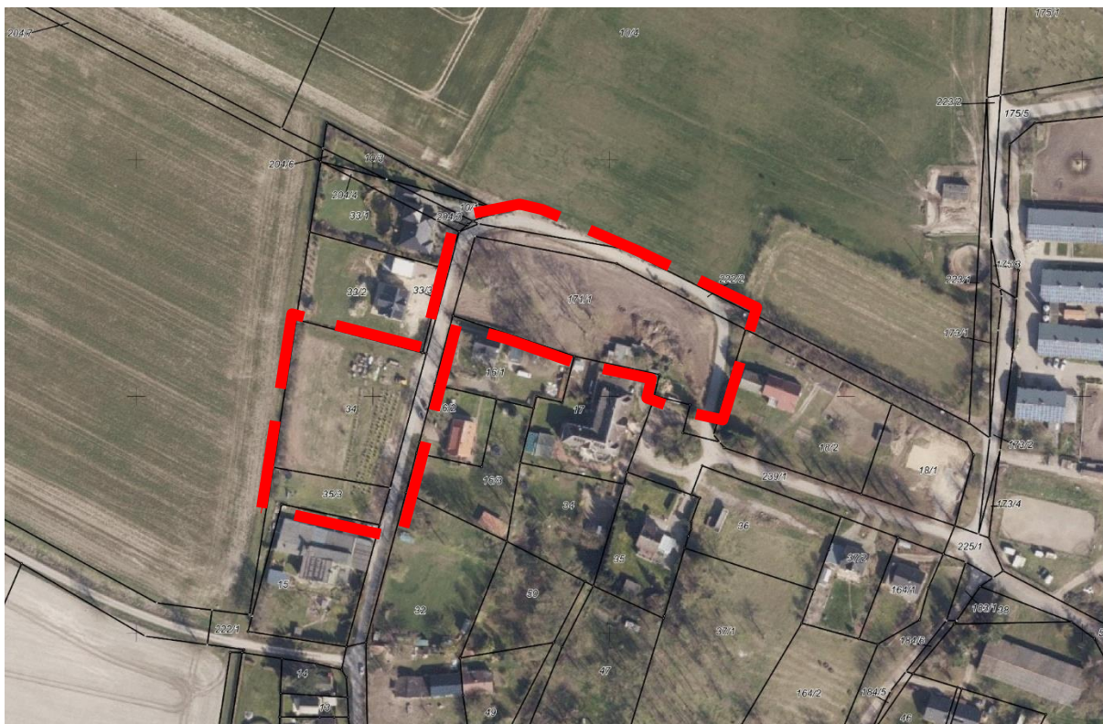
Abb. 1: Luftbild mit Geltungsbereich der 5. Änderung des Bebauungsplanes Nr. 24, © GeoBasis DE/M-V 2021.

Die 5. Änderung des Bebauungsplanes Nr. 24 umfasst die Flurstücke 10/4 (teilw.), 34, 35/3, 171/1 (teilw.) und 222/2 (teilw.) der Flur 1 in der Gemarkung Neuhof-Seedorf. Das Plangebiet wird begrenzt im Norden durch landwirtschaftliche Nutzflächen, im Osten und Süden durch Wohnbebauung und im Westen durch Wohnbebauung und landwirtschaftliche Nutzflächen.