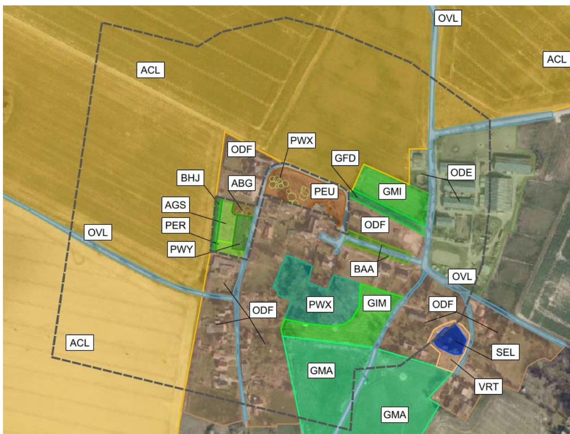
Abb. 3: Biotopkartierung für das Plangebiet 5. Änd. B-Plan Nr. 24 der Gemeinde Ostseebad Insel Poel mit Umfeld (200 m) Legende bzw. Abkürzungserklärung siehe vorangegangene Tabelle, Eigene Darstellung nach Angaben aus dem Luftbild, © GeoBasis DE/M-V 2021.