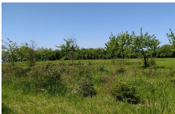
Abb. 2: Nadelbaumpflanzungen im Vordergrund, eigene Aufnahme.

Die Parkanlage im Anschluss an das alte Gutshaus besteht derzeit aus einer Rasenfläche mit mehreren Einzelbäumen sowie einem kleineren Stallgebäude für ein Pferd. Im Ursprungsplan wurden am westlichen Rand der Parkanlage Baumpflanzungen festgesetzt, diese wurden seither nicht vorgenommen. Für den Vorentwurf der 5. Änderung des Bebauungsplanes Nr. 24 wurde eine neue Vermessung beauftragt, unter anderem um den tatsächlich vorhandenen Baumbestand zu ermitteln.