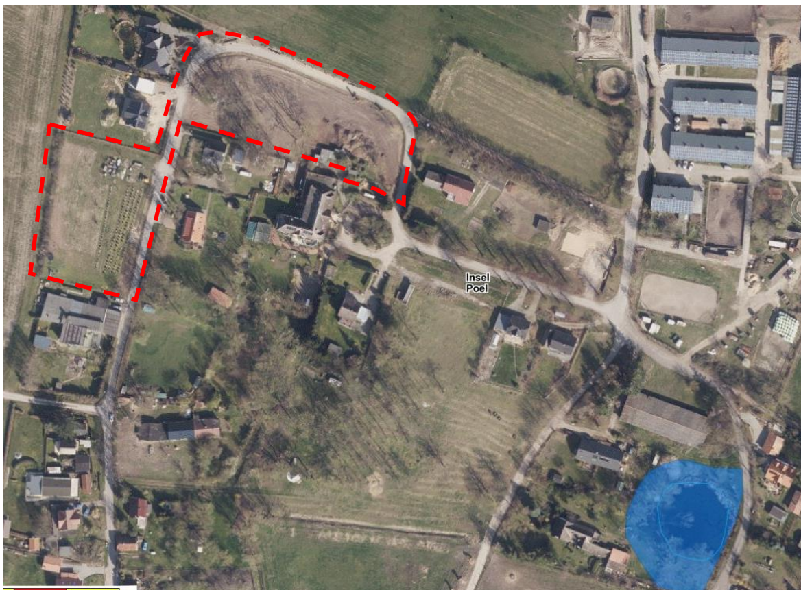
Abb. 1: Darstellung der geschützten Biotopstrukturen im Umfeld (200 m) der Ortslage Neuhof, © GeoBasis DE/M-V 2021.

Mit der Umsetzung der 5. Änderung des Bebauungsplanes Nr. 24 liegen keine direkten Eingriffe in geschützte Biotopstrukturen vor. Durch den benannten Bebauungsplan wird die Bebauung am nordwestlichen Ortsrand ergänzt, so dass von einer potentiellen Verstärkung von Licht- und Lärmimmissionen auszugehen ist. Bei der geplanten Bebauung handelt es sich um maximal zwölf zusätzliche Dauerwohngrundstücke im nordwestlichen Bereich von Neuhof. Die Immissionen werden nach Auffassung der Gemeinde aufgrund der Anzahl der zusätzlichen Gebäude sowie der bestehenden Beeinträchtigung als gering eingestuft. Die Gemeinde geht nicht von einer grundsätzlichen Änderung des Charakters einer dörflichen Ortslage aus. Auch unter Berücksichtigung der bestehenden Vorbelastungen werden mit der Umsetzung der 5. Änderung des Bebauungsplans Nr. 24 der Gemeinde Ostseebad Insel Poel keine erheblichen Beeinträchtigungen erwartet.