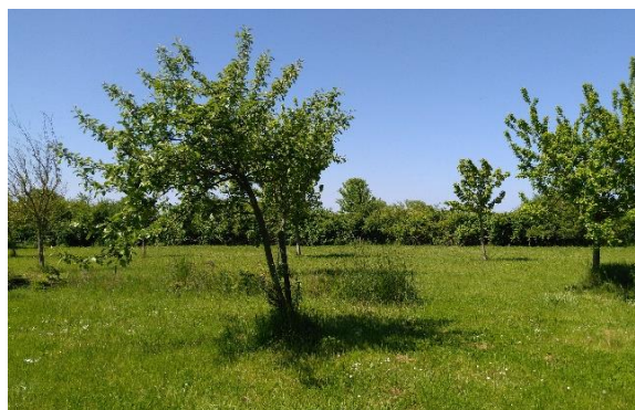
Abb. 3: Vorhandene Streuobstwiese, eigene Aufnahme.