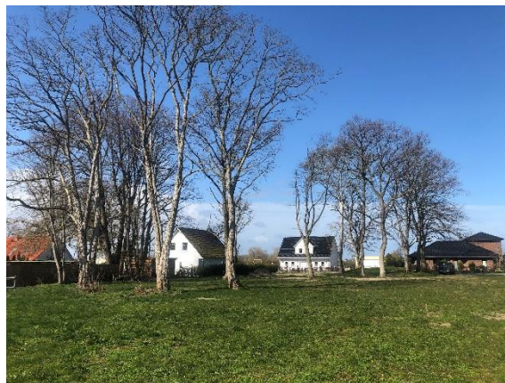
Abb. 5: Vorhandener Baumbestand der Parkanlage.