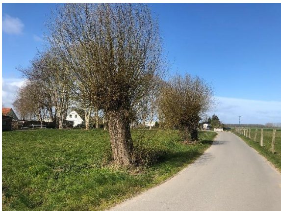
Abb. 4: Hauptstraße im Norden mit älteren Weiden im Bestand.